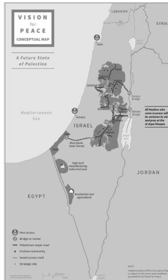
Trump dévoile la carte des États palestinien et israélien selon son « plan de paix »

Signez la pétition en ligne : http://chnq.it/p2LkVztq8z